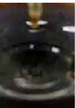
水中から浮上してくる液滴