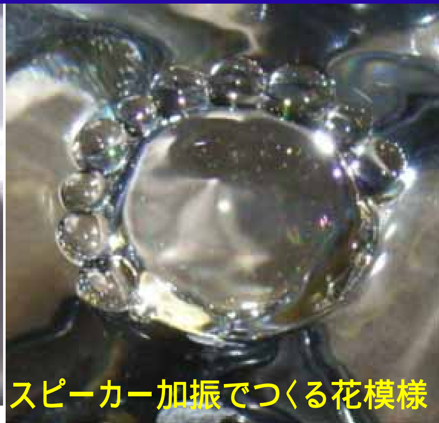
スピーカー加振でつくる花模様